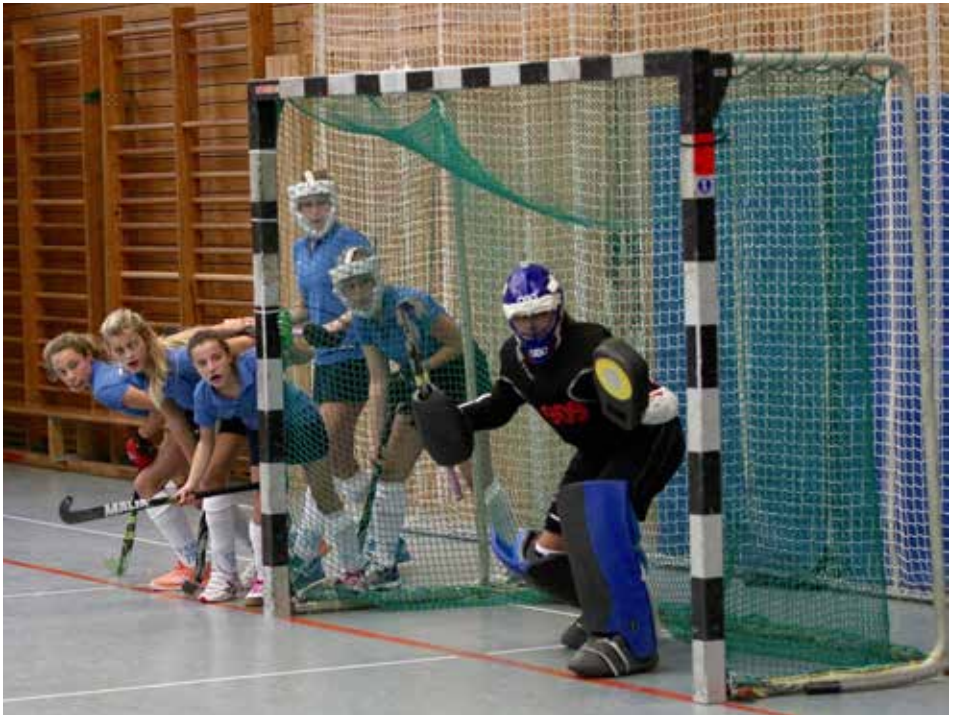
Die Abwehr in Erwartung einer Strafecke