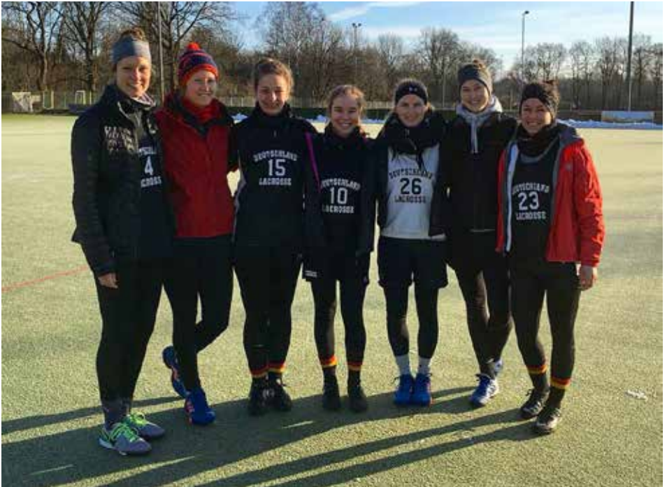
Sieben unserer Damen beim Natio-Camp in Hamburg an einem kalten verschneiten Wochenende

werden konnte. Von den erfahrenen Coaches konnte dann wieder viel gelernt werden und es waren auch einige nützliche neue Übungen für unser Training zu Hause mit dabei. Zeitgleich fand in Frankfurt das U20 Jugend Camp statt, an dem zwei weitere unserer Damen teilnahmen.