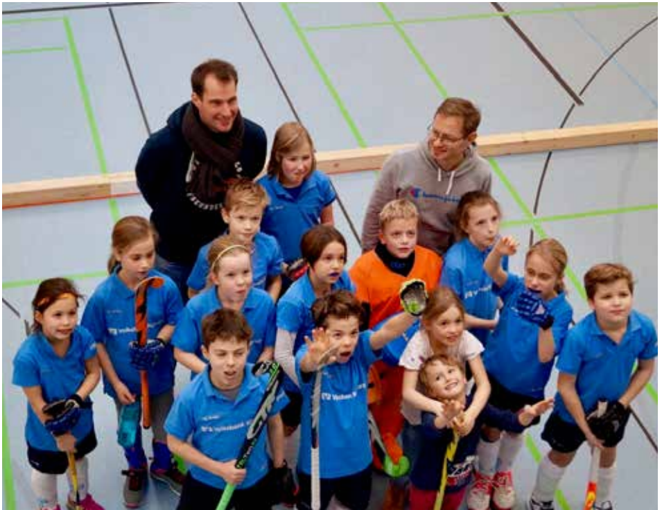
Mannschaft, Trainer und Fans freuen sich über vier Turniersiege