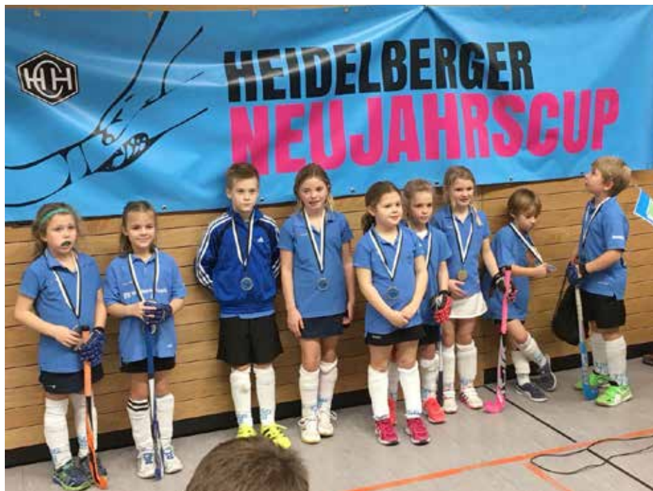
Stolz werden die Medaillen präsentiert

ßenden Siegerehrung ihre tapfer erkämpften Medaillen in Empfang. Wir danken Allen, die zu diesem schönen Tag beigetragen haben und freuen uns auf eine tolle Hockeysaison 2018 mit vielen, spannenden Matches. Rainer