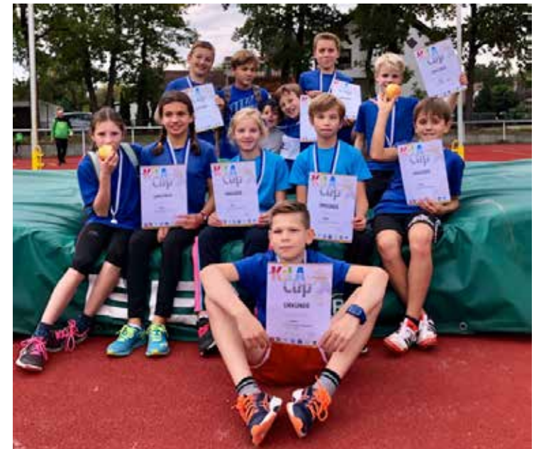
...und einen tollen 2. Platz in Schwetzingen.