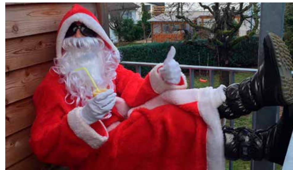
Nach derartigen, sportlichen Höchstleistungen erholt sich der alte Mann bis Dezember 2020 nun im Urlaub

In den Faschingsferien vom 24. – 28. Februar 2020 sind die Turnhallen geschlossen und der Trainingsbetrieb findet daher nicht statt. Über weitere Schließtage seitens der Schule informieren wir Sie auf der Homepage oder per Aushang in der Mönchhofschule.