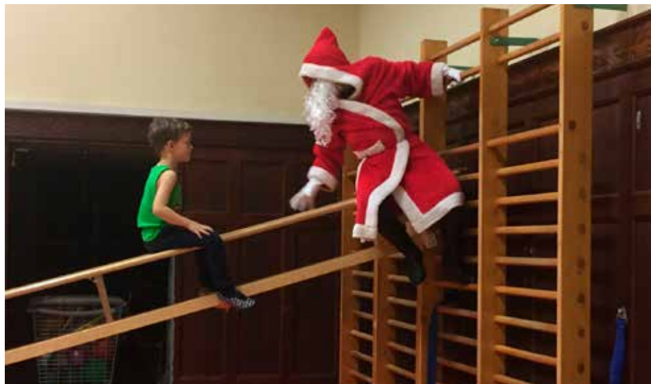
Weil der Nikolaus sich zunächst nicht allein auf die Hochrutsche traute, bekam er mutige Hilfestellung