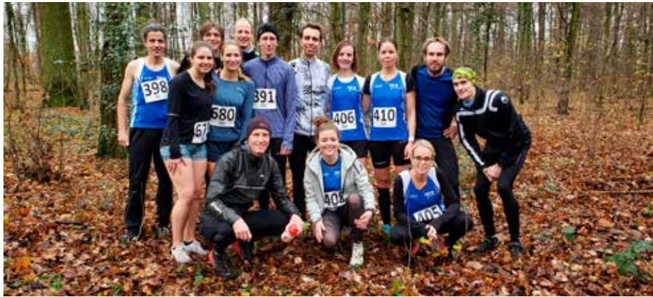
Unsere Langstreckler freuen sich über viele Titel und Medaillen