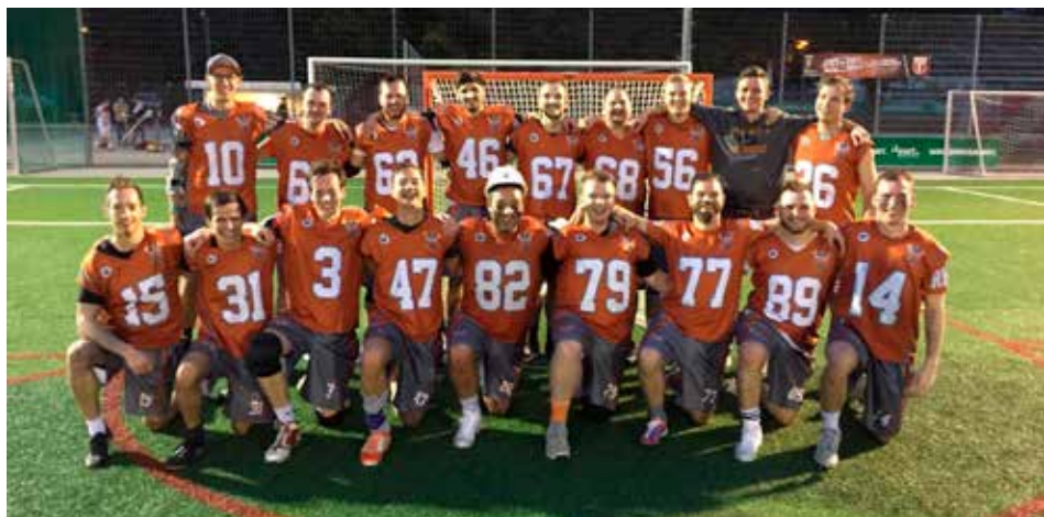
Die Teams der RNL A und B, die zurzeit im oberen und mittleren Drittel der Tabelle der Landesliga Ba-Wü aufgestellt sind

Was für ein Endspurt der Lacrosse Herren! Nach einer Niederlage zu Saisonbeginn gefolgt von zwei Siegen (wir berichteten in der letzten Rundschau) standen nun gegen Karlsruhe und Stuttgart die zwei letzten Spiele der Hinrunde an.