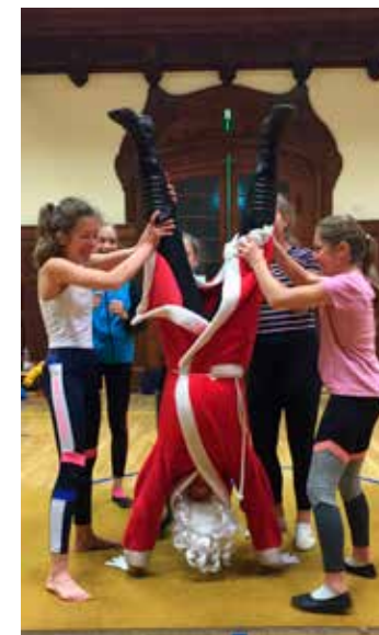
Alle hopp, rauf mit den Beinen, runter mit dem Bart!! Mit vereinten Kräften schaffte es der bärtige Mann einmal in den Handstand

Nun macht er es sich in seinem wohlverdienten Urlaub gemütlich, schlürft Frucht-Cocktails und sendet die besten Wünsche zum Jahreswechsel! Bis 2020!!! Ho ho ho!