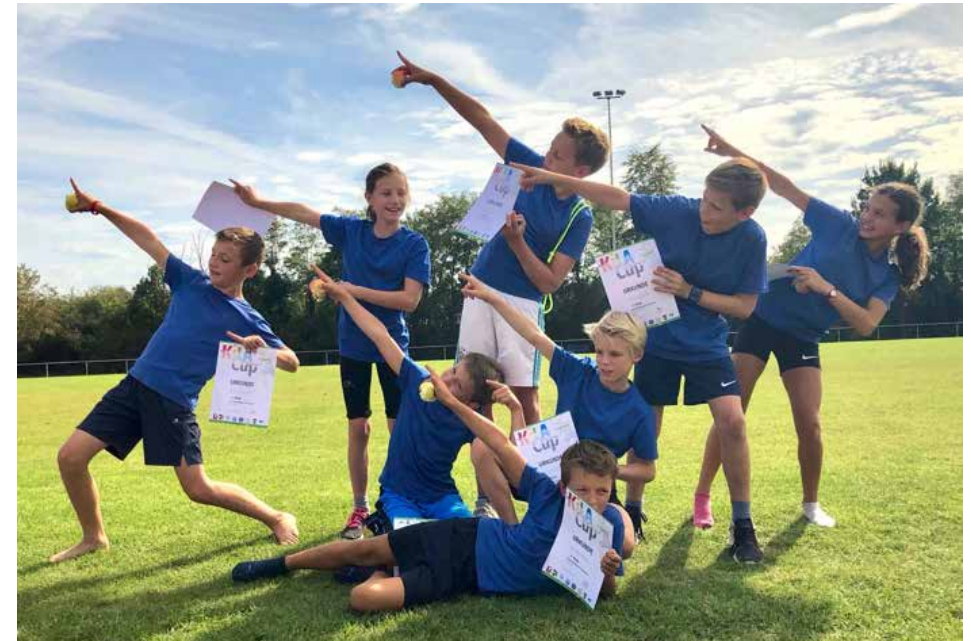
Die glückliche U12 beim Sieg in Eppelheim...

Vor allem aber hatten die Kinder ganz viel Spaß an der Bewältigung der zahlreichen und vielfältigen KiLa-Disziplinen.