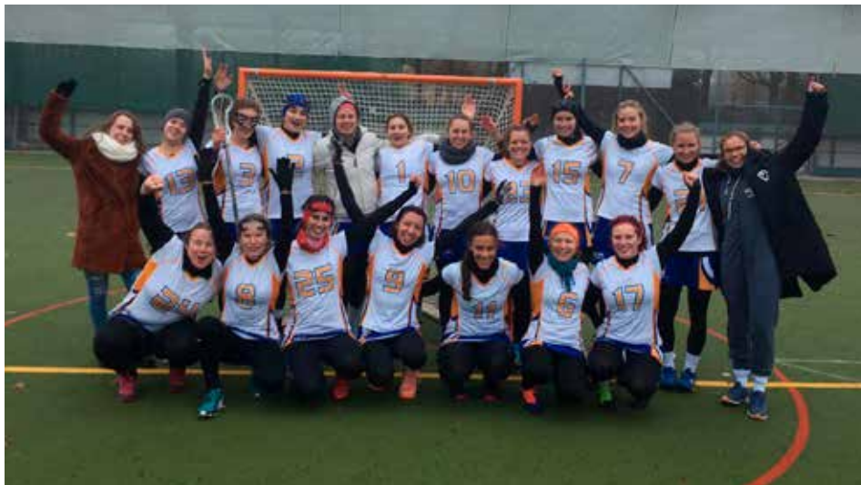
Ein hartes umkämpftes Unentschieden, ein klarer Sieg und viel Nebel beim Doppelheimspieltag der Damen