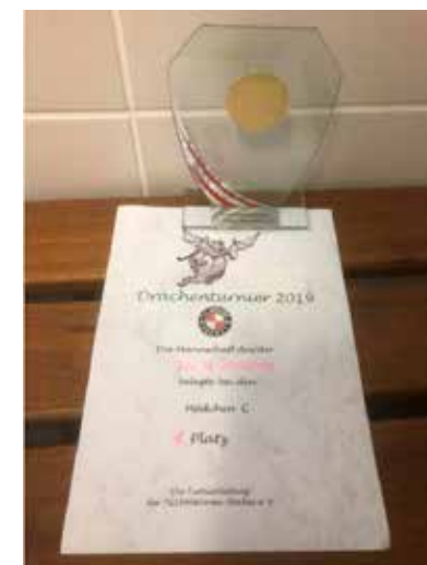
Der verdiente Lohn für harten Kampf