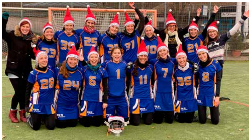
Unsere Lacrosse Wichtel zum Hinrundenabschluss in Stuttgart