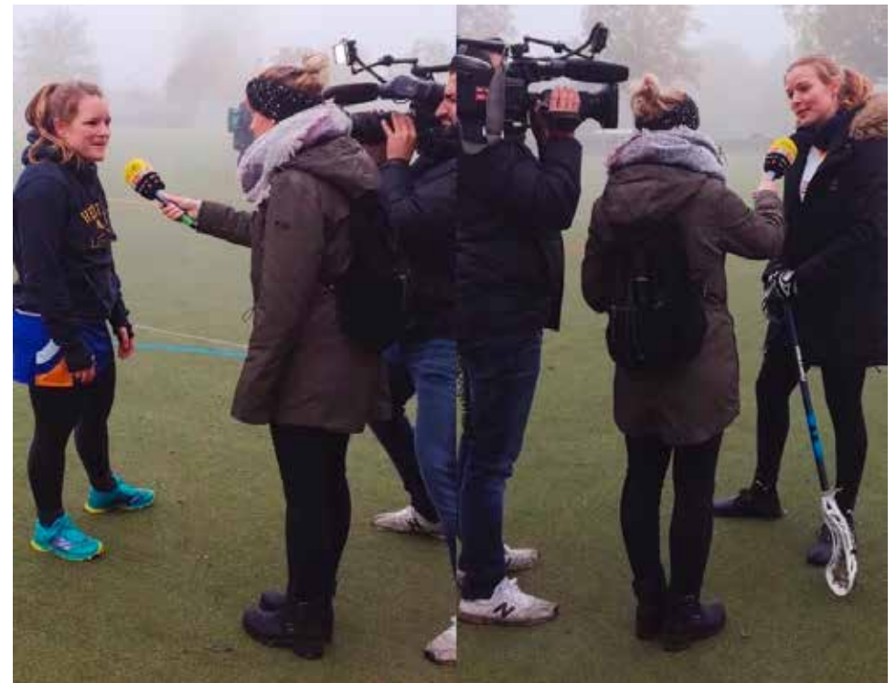
Auch RON TV war wieder da und hat unsere Captains nach dem Spiel noch interviewt. Seht das Video hier: https://www.rontv.de/sendung-vom-12-11-2019/

Berücksichtigen Sie beim Einkauf bzw. bei der Auftragsvergabe unsere Inserenten. Sie helfen uns bei der Finanzierung dieser Vereinszeitung.