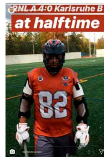
Auf halber Strecke zum Sieg gegen Null im Spiel mit der SG Karlsruhe B/Freiburg B