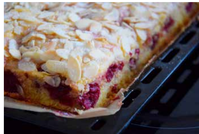
Blechkuchen und ähnliches sind ideale Backwaren-Spenden für den 15.03.2020