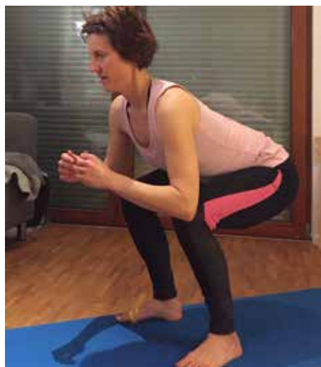
Man hat immer dabei, was für ein effektives Training notwendig ist: den eigenen Körper