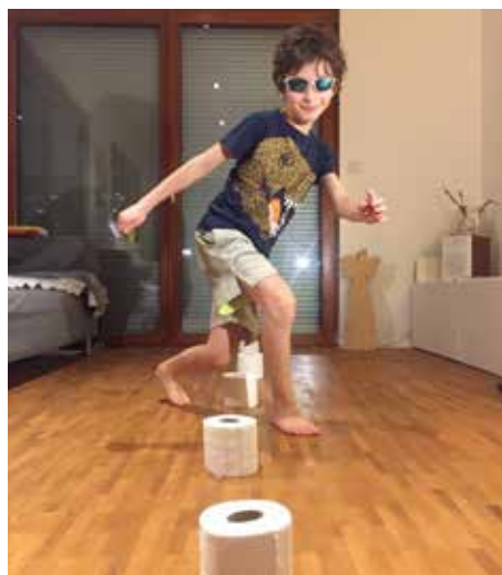
Typisch Online-Kinderturnen: Slalom durch Toilettenpapierrollen – Koordination, Schnelligkeit und Spaß – 3 Dinge auf einmal. Es kann so einfach sein.