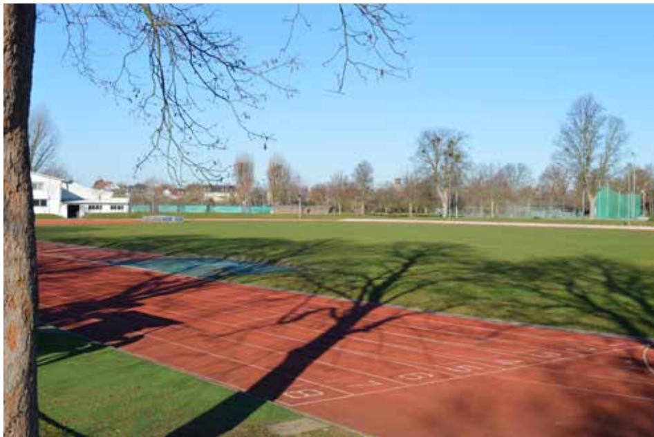
Trotz gutem Wetter ist leider coronabedingt fast immer gähnende Leere im TSG-Sportpark

dies ebenso zu tun. V.a. unser wunderschöner, grüner Sportpark lädt gerade jetzt dazu ein, sich darin zu bewegen. Die Verordnung erlaubt derzeit, dass man allein wie auch in einer Gruppe von max. fünf Personen aus höchstens zwei Haushalten gemeinsam trainieren darf. Unsere Belegungspläne (jede Abteilung organisiert diese eigenständig) sorgen dafür, dass dies verordnungsgerecht geschieht. Infos dazu gibt es bei Eurer Abteilungsleitung und teilweise auf den Abteilungs-Webseiten. Also schnappt Euch eine Freundin, ruft einen Trainingskameraden an, packt die Familie ein oder verabredet Euch mit einem befreundeten Pärchen. Von morgens bis zum frühen Nachmittag liegt unser