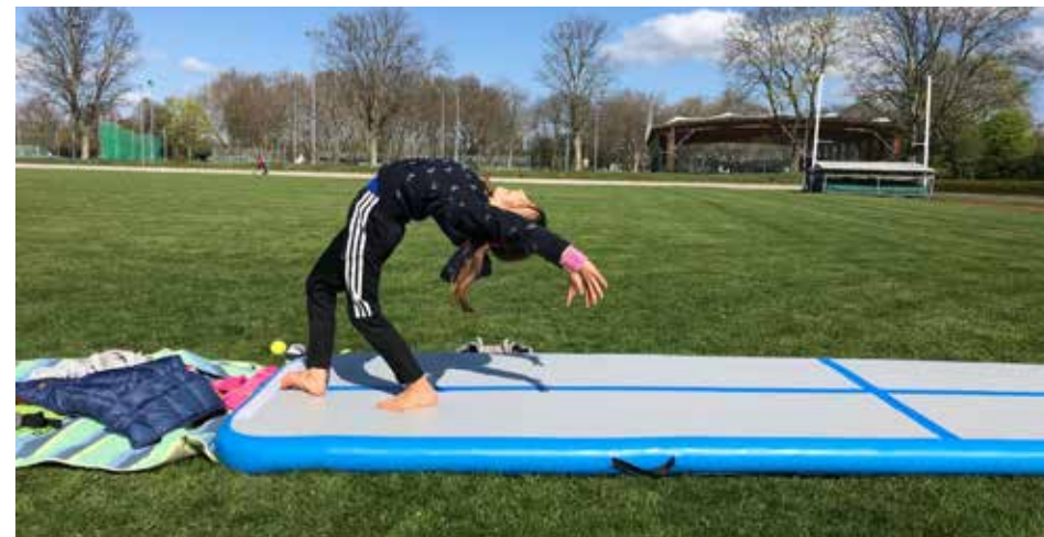
Ungewöhnliche Situationen erfordern ungewöhnliche Maßnahmen: Gerätturnen im Freien