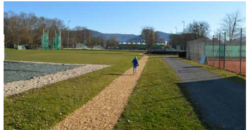
Bewegung in der Frühlingssonne kann über den Corona-Frust hinwegtrösten.