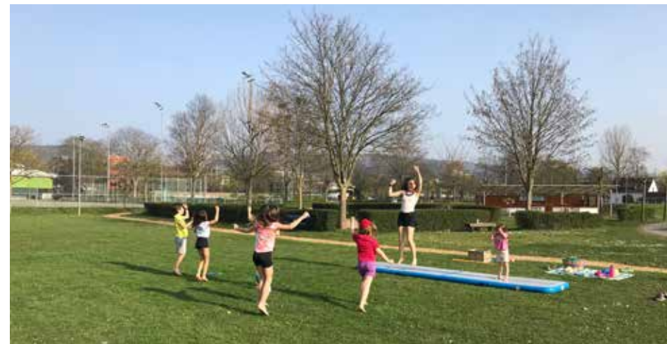
Sonne, Frühling, nackte Turn-Füßchen am Gründonnerstag im TSG-Sportpark