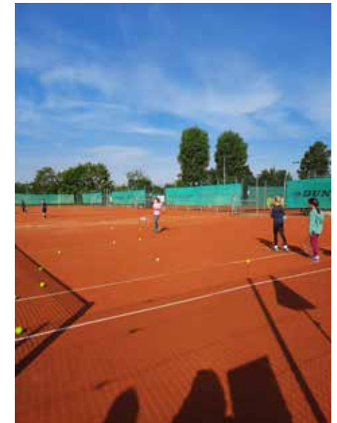
Viele Sportarten können bei den Ferien-Champs ausprobiert werden...